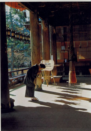
Rei – vor einem buddhistischen Tempel.

Betrachtet man die zentralen Begriffe sittlich-ethischen Verhaltens, Begriffe, die niemals in Verbindung zu bringen sind mit Spass, Spekulation und einem »probier mal!«, so stehen diese deutlich ausserhalb des Kontexts »Religion«, obschon sie punktuell in den Rahmen von »Religion« hineinwirken können. Diese Begriffe sind mit einer ähnlich schweigsamen, ehrfurchtserfüllten Atmosphäre assoziierbar, wie wir sie im Westen etwa von einer Kirche her kennen, doch ist ihre Ortsbindung eine ganz andere: Wir finden sie etwa im Rahmen einer Teezeremonie, eines o-keiko (Unterricht in einer Fertigkeit, die ein in einer Überlieferungslinie stehender Meister in der Regel in traditioneller