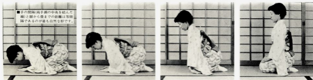
Rei – bei der Begrüssung in einem Privathaus (von rechts nach links).